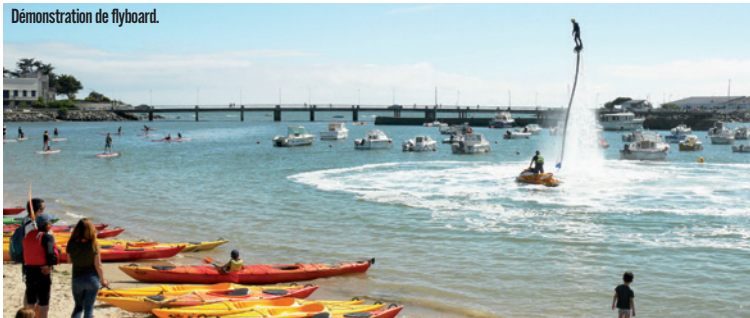
Démonstration de flyboard.