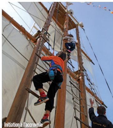
Initiation à l'accrovoile

100 % Nautik : samedi 4 et dimanche 5 mai, de 11h à 18h, à l'espace dunaire et au square Hervo, Pornichet. Gratuit. Programme complet sur : www.pornichet.fr Renseignements : 02 40 11 55 55.