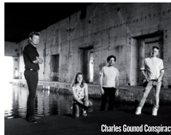
Charles Gounod Conspiracy

Soirée nazairienne avec le power trio Black Rocket et le combo Charles Gounod Conspiracy.