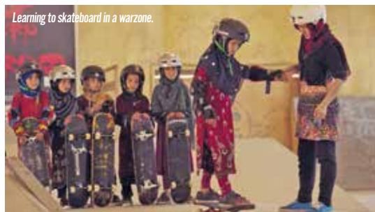
Learning to skateboard in a warzone.