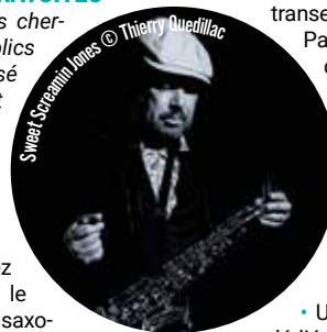
Sweet Screamin Jones