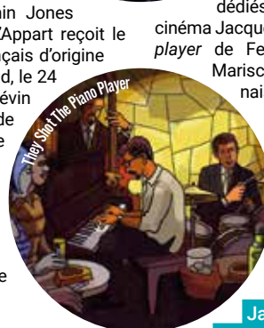
They Shot The Piano Player