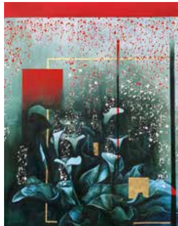
Œuvre d'Abigahél Dantzer.

• La sculptrice Tinou fabrique des structures qu'elle recouvre d'une poudre à base de papier.