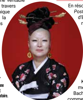
La figure de proue de la danse coréenne réinvente la rencontre entre Orient et Occident dans une chorégraphie jubilatoire.

Post Orientalist Express, vendredi 30 janvier, 20h30, tarifs : de 20 € à 40 €. Rens. 02 40 22 91 36, accueil@letheatre-saintnazaire.fr , letheatre-saintnazaire.fr