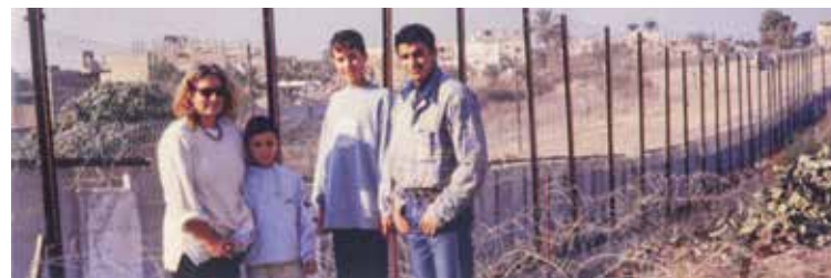
Rafaa, frontière entre la bande de Gaza et l'Égypte.