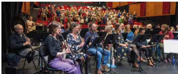
L'orchestre et la chorale réunis à l'auditorium du conservatoire pour les répétitions.

Ils seront près de 150 sur scène ce week-end.