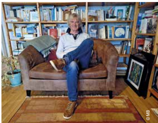
Ce livre est une façon « de déboulonner les statues, de montrer que ce grand érudit n'était pas si extraordinaire que ça ! Je ne parle de rien d'autre que de sa vie de tous les jours, et de son amour pour Laure ».