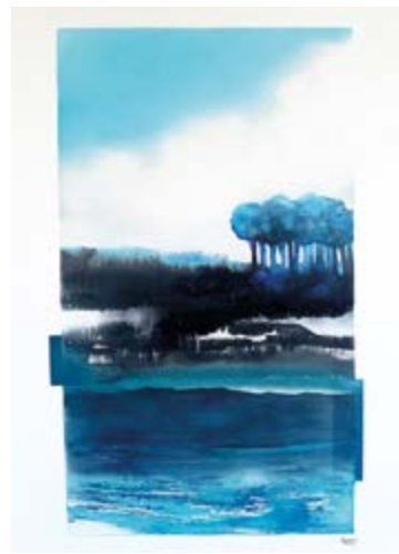
Peinture de Nessa.

Info + : appel aux dons pour équiper les lieux (chaises, tapis, étagères, chevaux...). Rens. amplituddegalerie@gmail.com