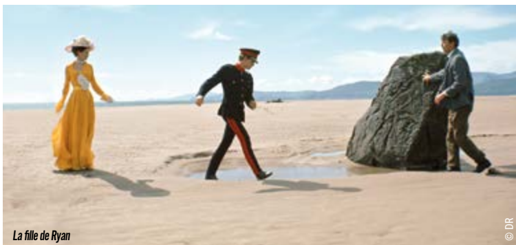
La fille de Ryan

et ses toiles, toutes voiles dehors. Une 11 e édition 100% craic !