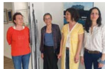
Amplitude Galerie : le nouveau lieu hybride de Saint-Nazaire