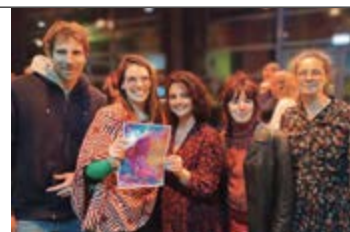
Bal Tempête, entre électro et folk