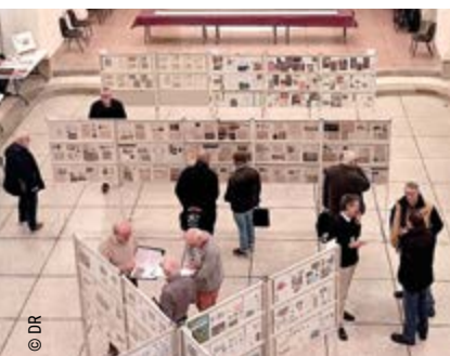
Le club philatélique nazairien est présent depuis 100 ans lors des événements marquants de Saint-Nazaire.

L'occasion pour le club philatélique nazairien de fêter ses 100 ans.