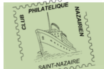
100 ans pour le club philatélique nazairien