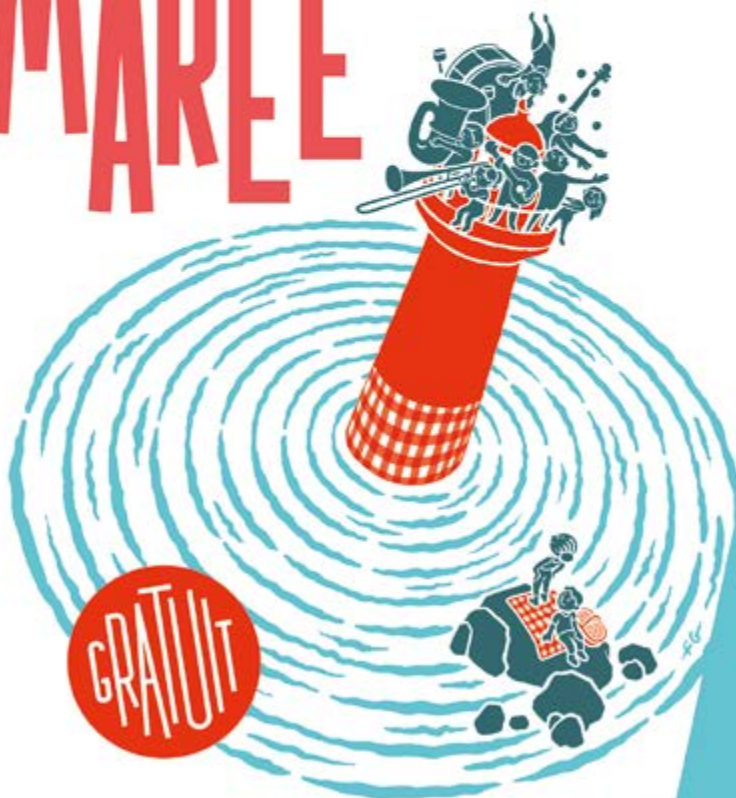
Illustration de la communication et de l'accompagnement - Ville de Saint-Nazaire 2024 - Illustration Fabrice Dubaud

PIQUE-NIQUE GÉANT BALS & FANFARES GRAND FINAL